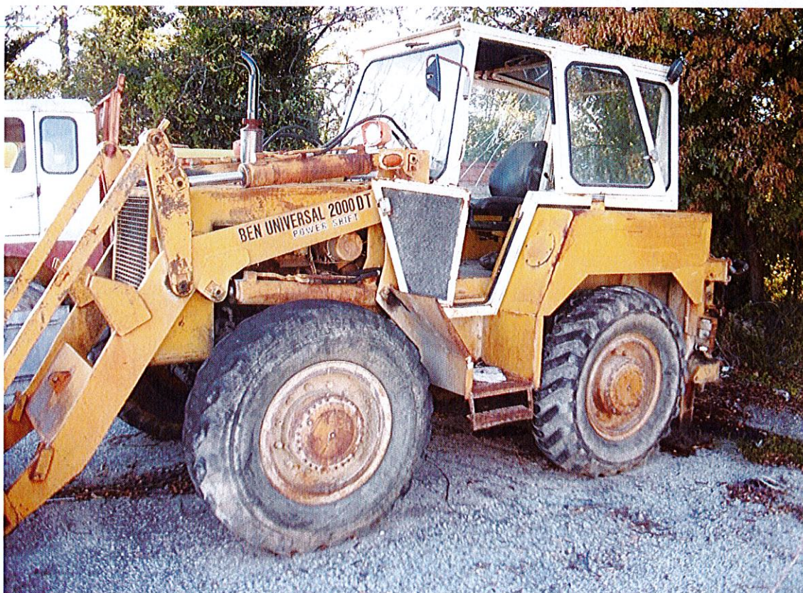
Foto 11 Parte laterale dx della macchina operatrice