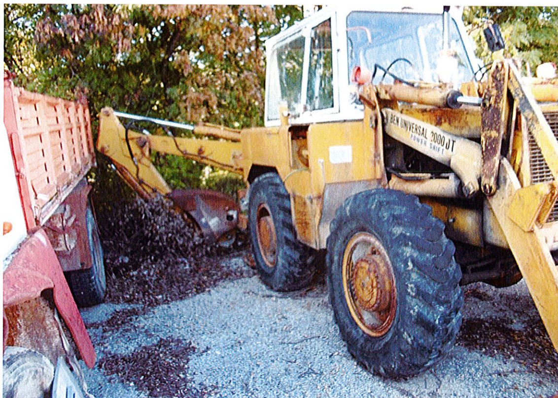
Foto 13 Parte laterale sx della terna meccanica