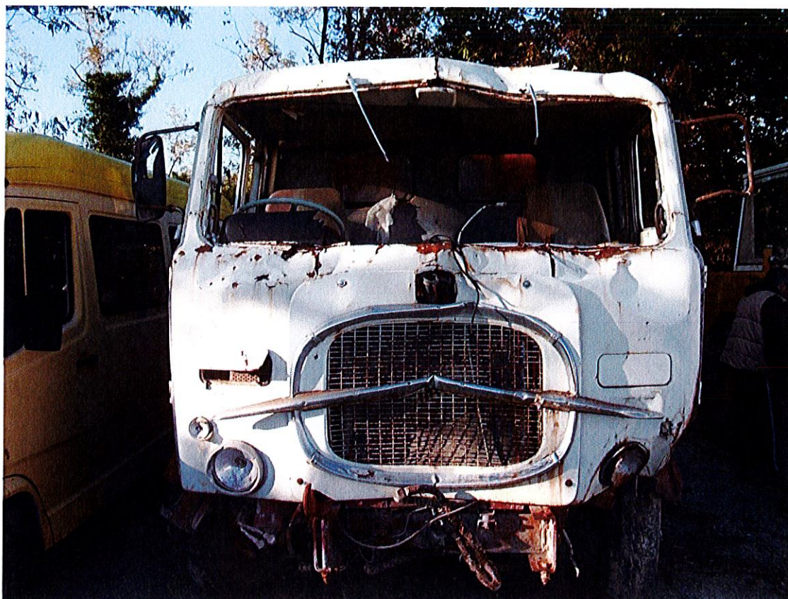
Foto 5 Ulteriore parte anteriore dell'autocarro. È possibile notare la cabina dell'autocarro completamente distrutta, avantreno piegato e ruggine su tutte le parti