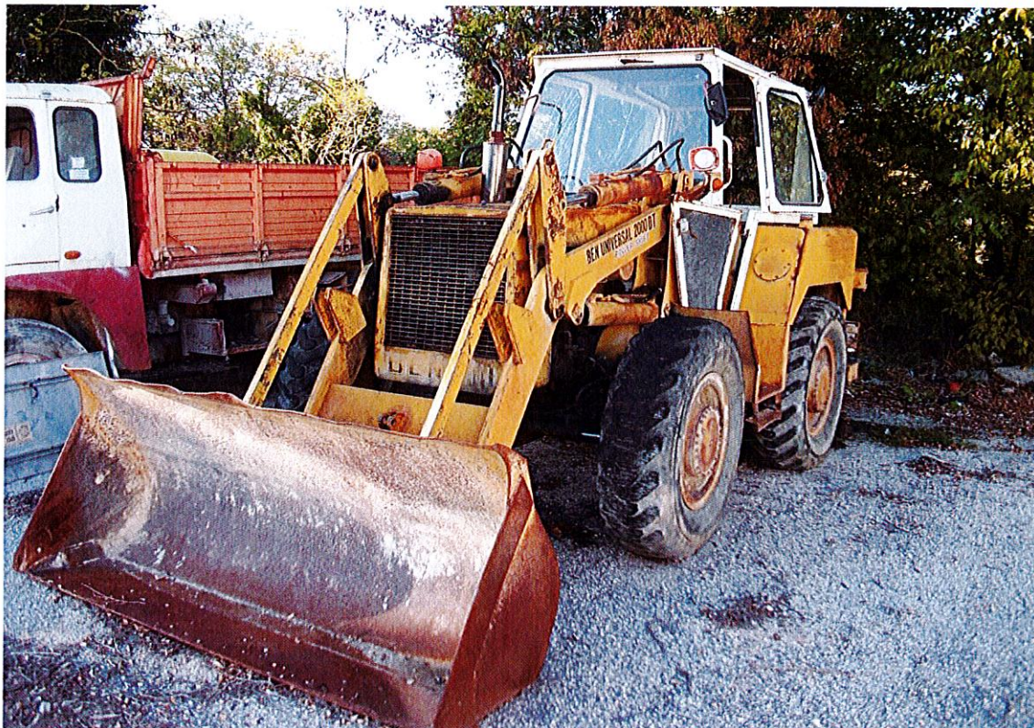
Foto 10 Parte anteriore laterale dx della macchina operatrice