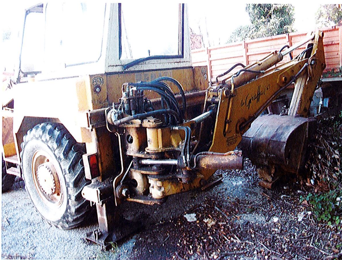
Foto 12 Parte posteriore della Terna gommata. Si può constatare la mancanza della targa