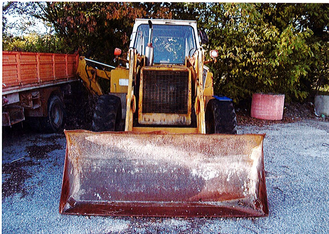
Foto 9 Parte anteriore della macchina operatrice