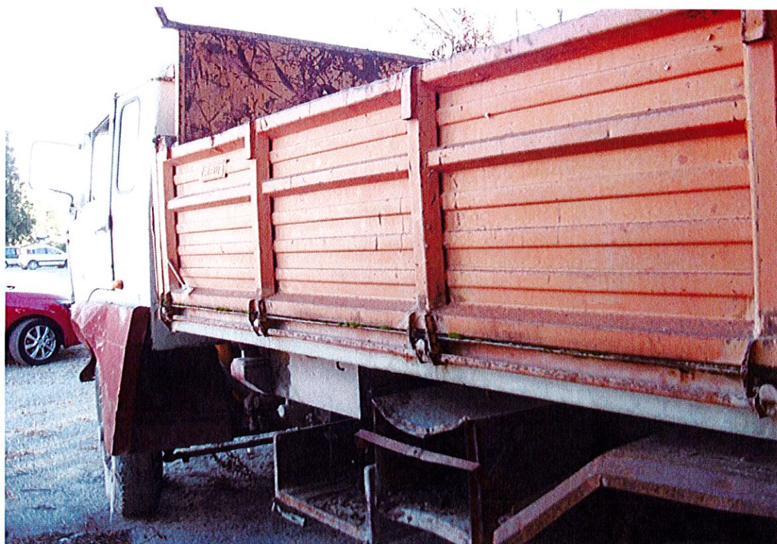
Foto 6 parte laterale destra dell'autocarro