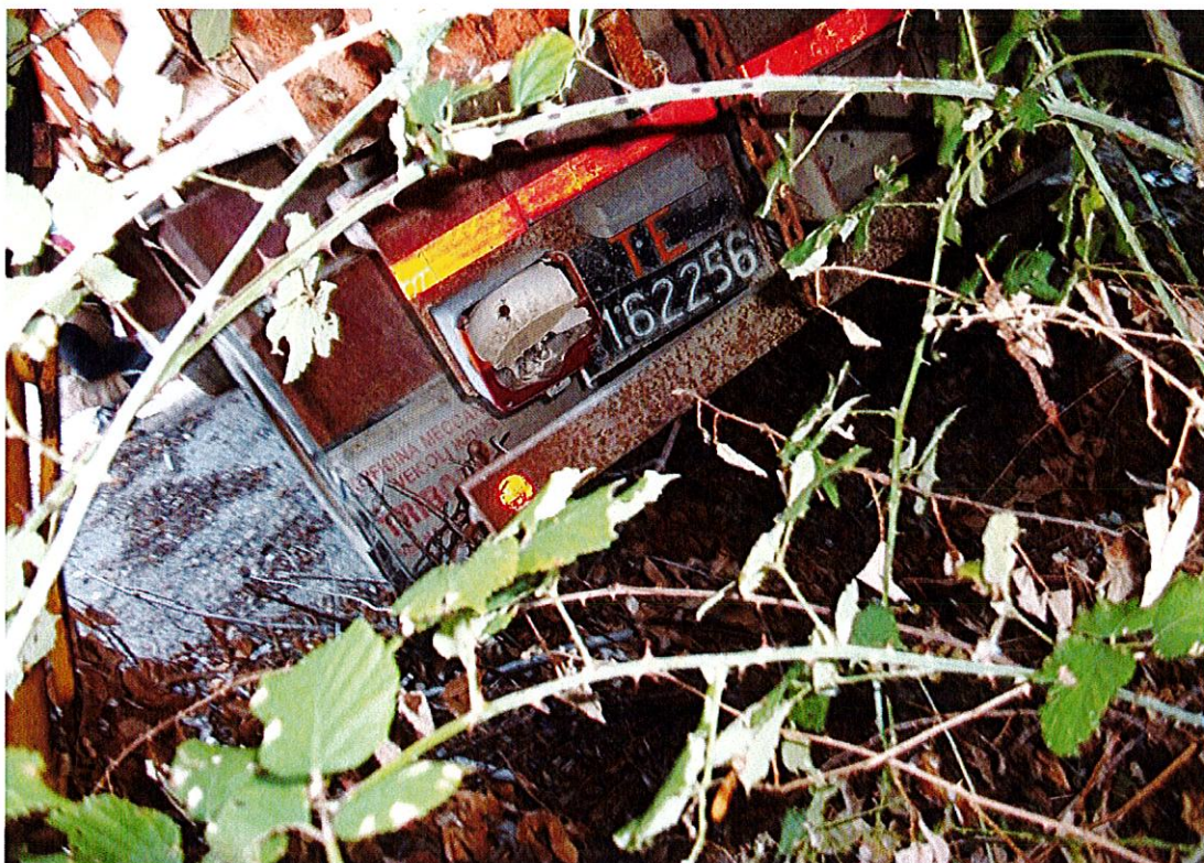
Foto 1 Targa posteriore Autocarro Fiat 643