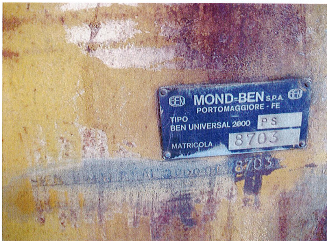
Foto 15 Particolare della targhetta identificativa e punzonatura nr. telaio della terna