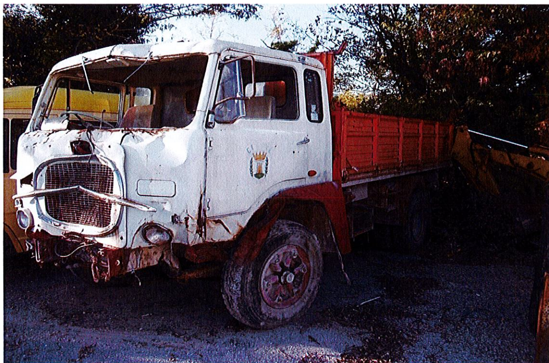
Foto 2 Parte anteriore dx autocarro e relativo cassone