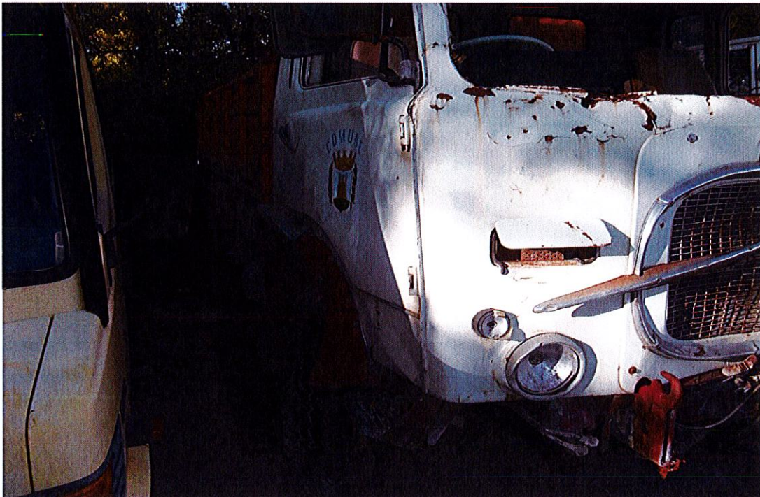
Foto 4 Parte anteriore dx dell'autocarro