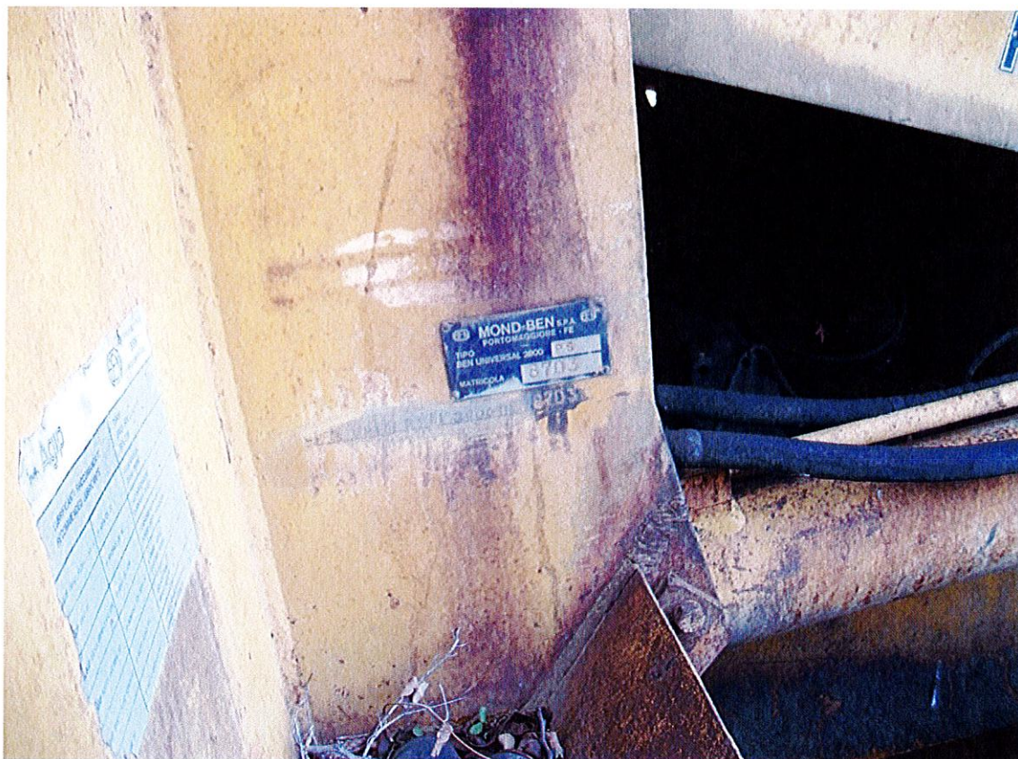
Foto 14 Targhetta identificativa e punzonatura del numero di telaio della terna