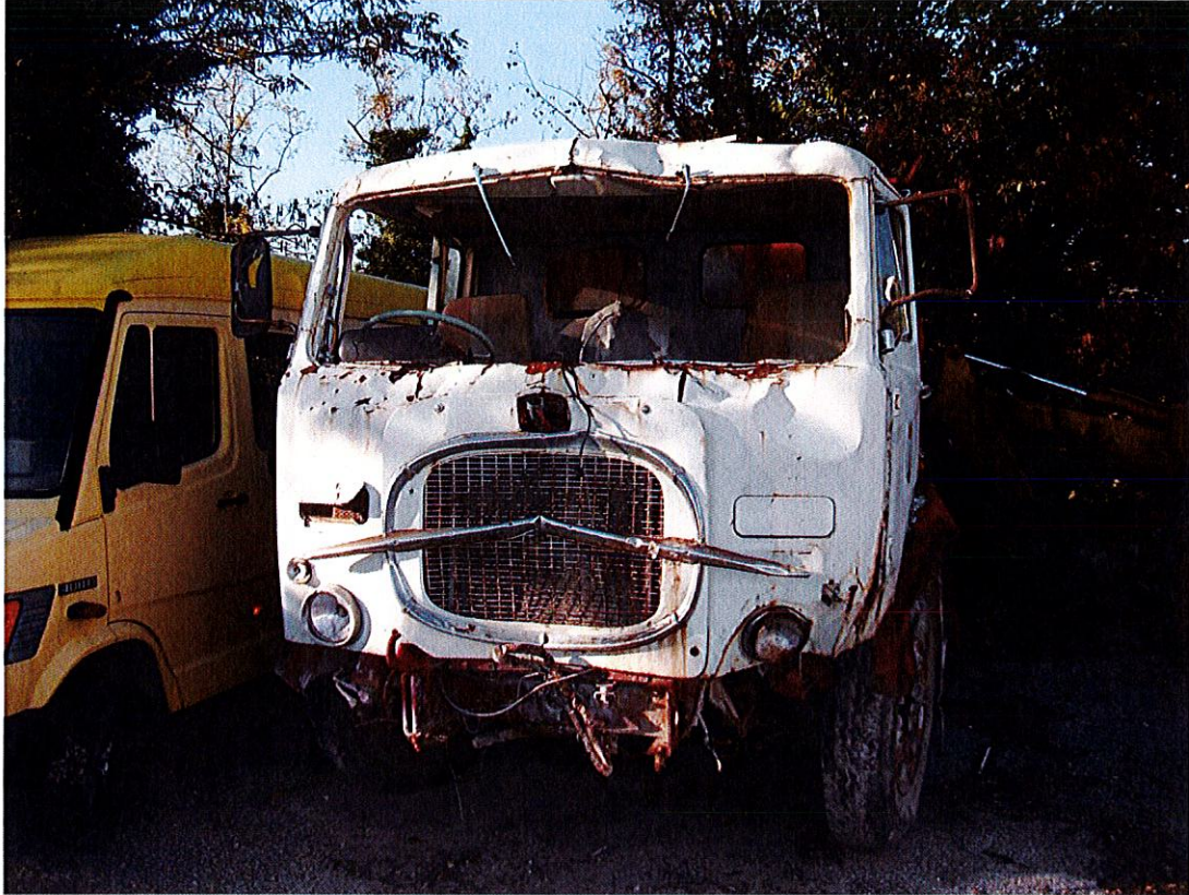
Foto 3 Parte anteriore cabina autocarro. Dalla foto si può constatare la mancanza della targa anteriore del mezzo