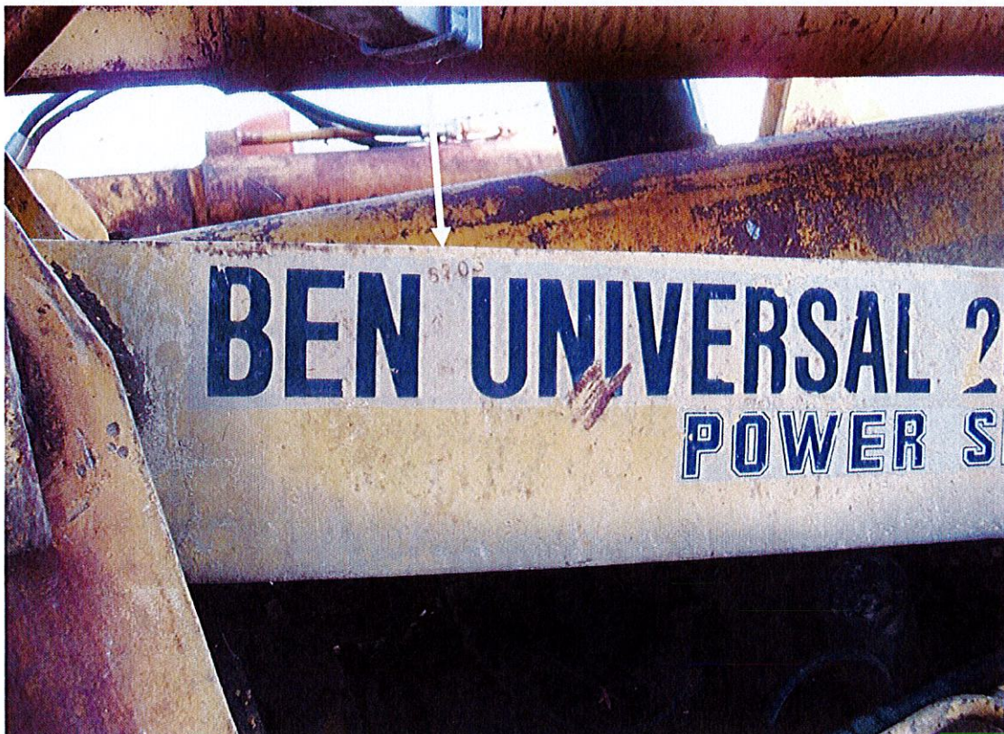
Figura 17 Particolare della punzonatura del nr. di telaio. La freccia indica la punzonatura