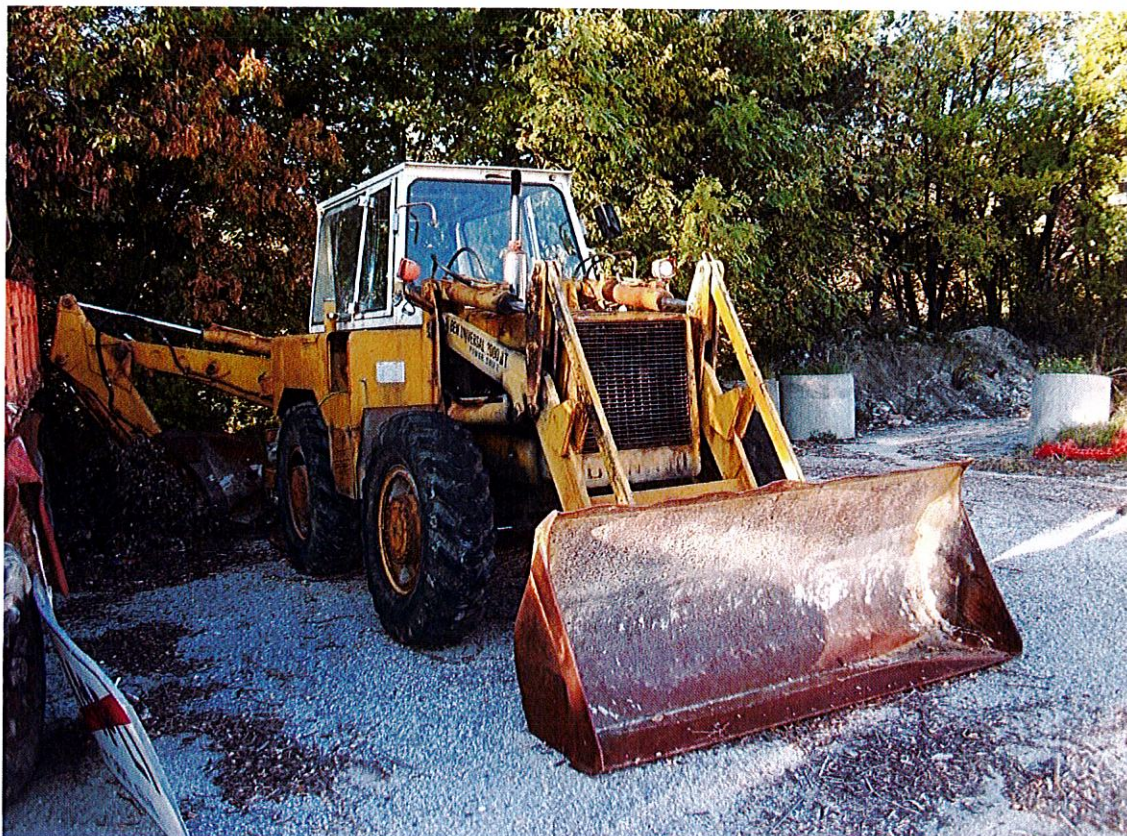
Foto 8 Parte anteriore laterale dx della terna gommata "BENATI". È visibile il caricatore a "cocchiaia" nonchè l'escavatore posteriore