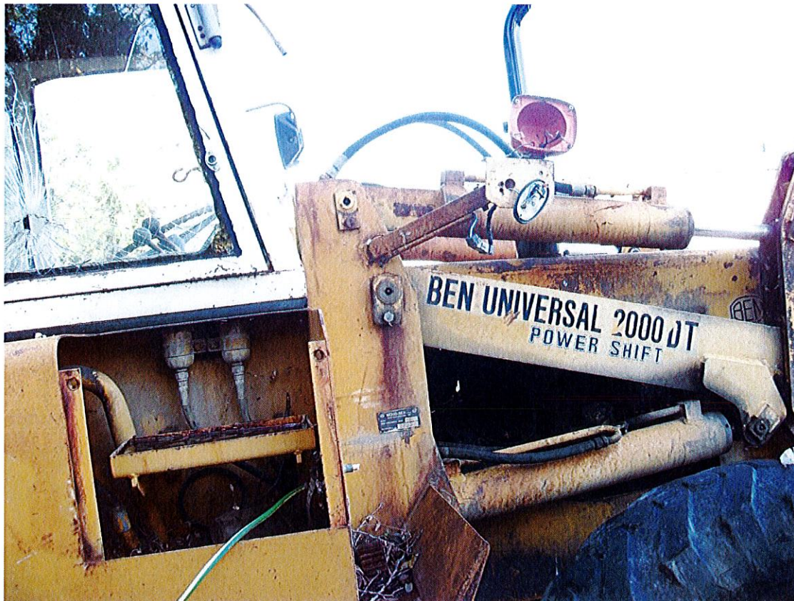
Figura 16 Punzonatura del nr. telaio anche sul braccio sx del caricatore